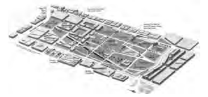
Concurso de ideas. Primer puesto

Desde aquí, se abordaron los frentes de gestión: compra de predios, acciones de sostenibilidad y desarrollo del proyecto arquitectónico, temas que fueron inseparables en el proceso. No se compró suelo, sin acometer previamente la gestión social. Se compraba manzana por manzana en áreas “controlables” desde la periferia hacia adentro, con el fin de conseguir gobernabilidad del territorio y evitar la invasión de los predios, o tener al final dispersión de predios adquiridos por toda la zona, donde sería imposible realizar un proyecto. Quedó para el final, la zona más deteriorada, habitada por la población de difícil integración social. De igual forma, el proyecto