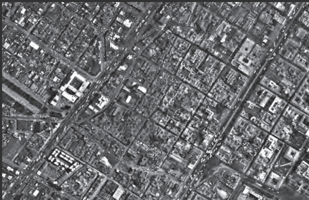
Fotografía aérea. Enero de 1999.