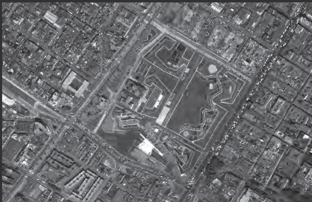
Fotografía aérea. Enero de 2006.