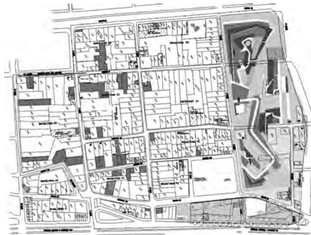
Estado enero de 2003