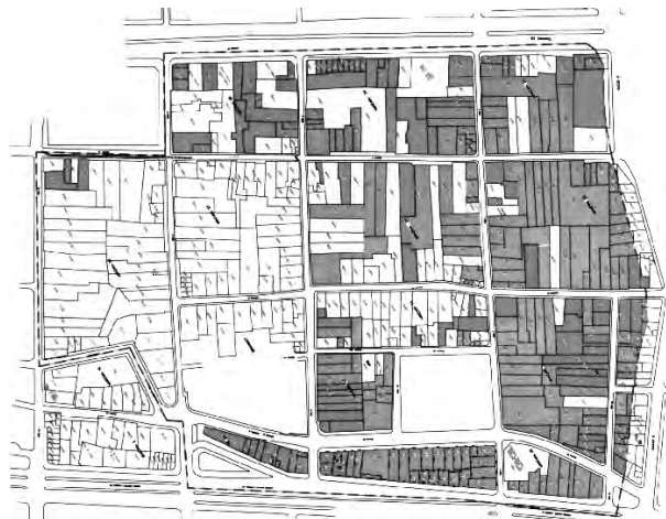
Estado año 2001