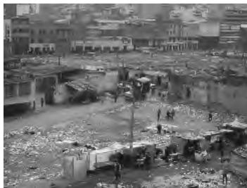
Fotografía del sector

En 1998 la administración de entonces le hizo un seguimiento a la evolución de la zona y se encontró que, sumado a las condiciones de miseria, existían bodegas de reciclaje y negocios ilícitos —venta de armas, expendio de droga, etc.—. Estas actividades habían obligado a emigrar a los últimos propietarios residentes, para dar paso al albergue de poblaciones en emergencia social, en abandono, madres jóvenes y niños que compartieron espacio con indigentes y drogadictos en la calle y los inquilinatos.