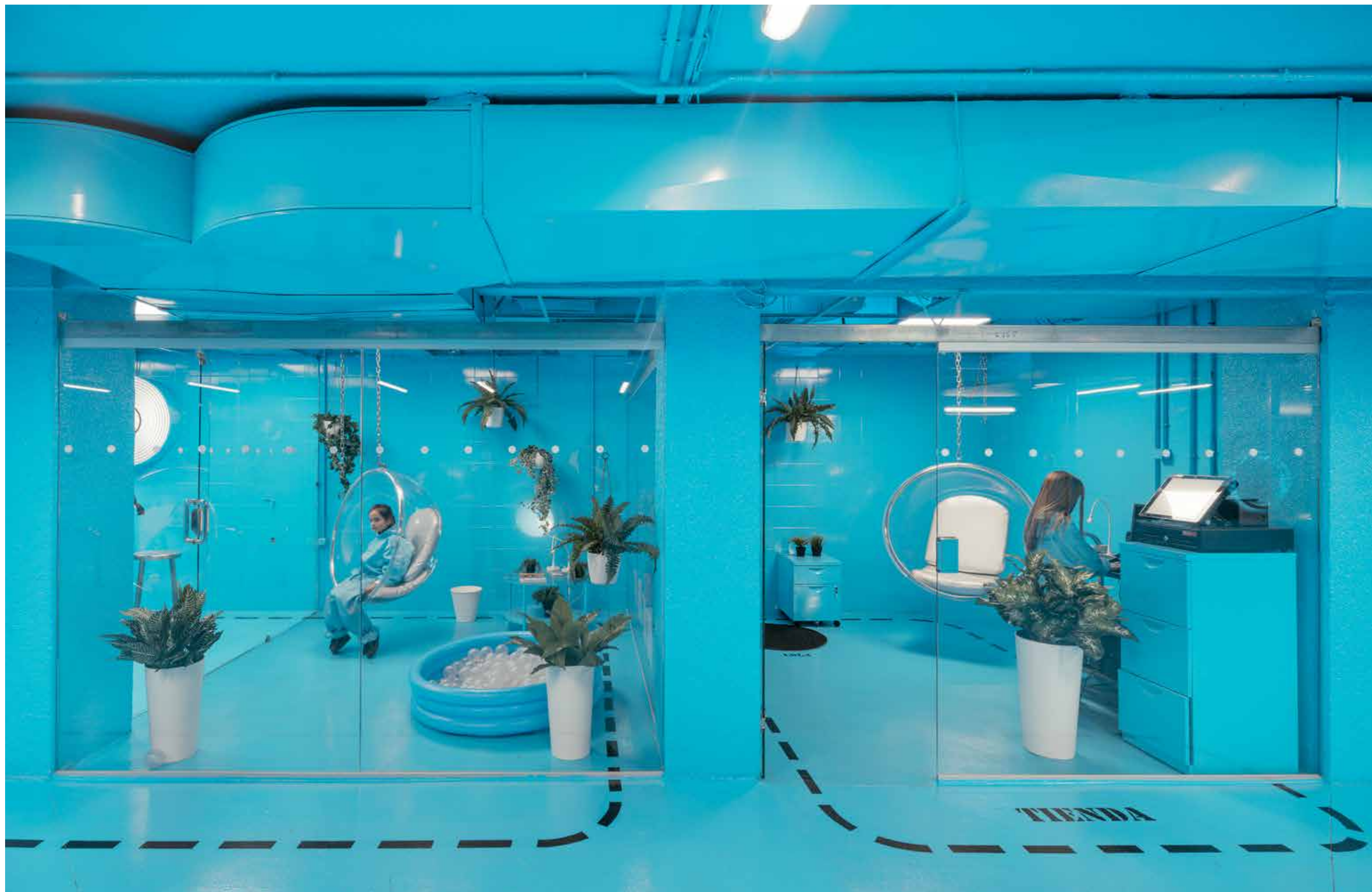
Espacios de espera del proyecto