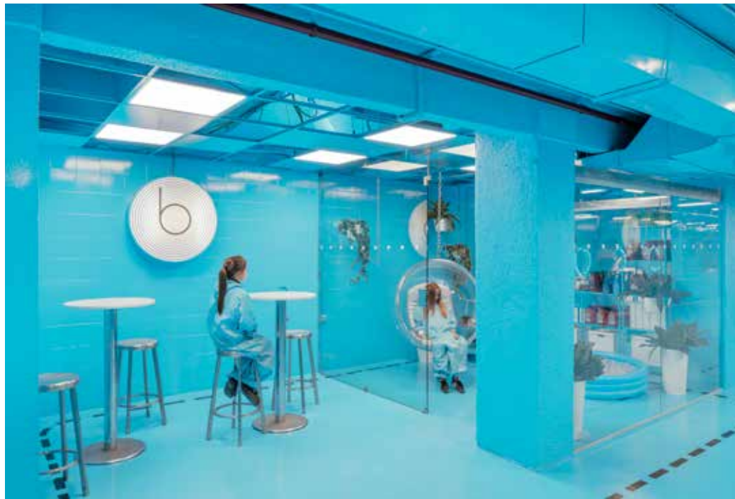
Espacios de espera del proyecto