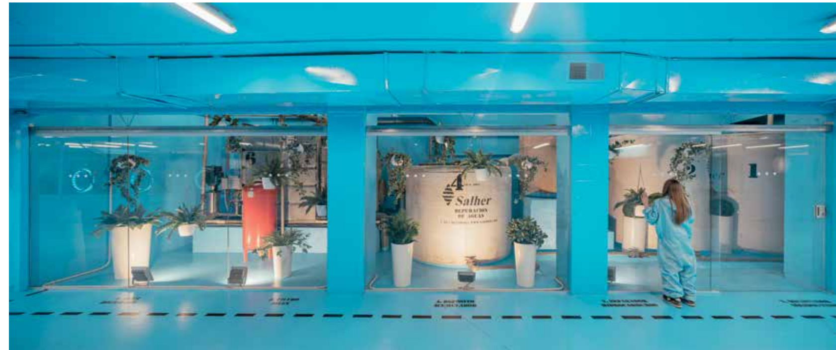
Espacios de espera del proyecto que muestran el proceso de lavado