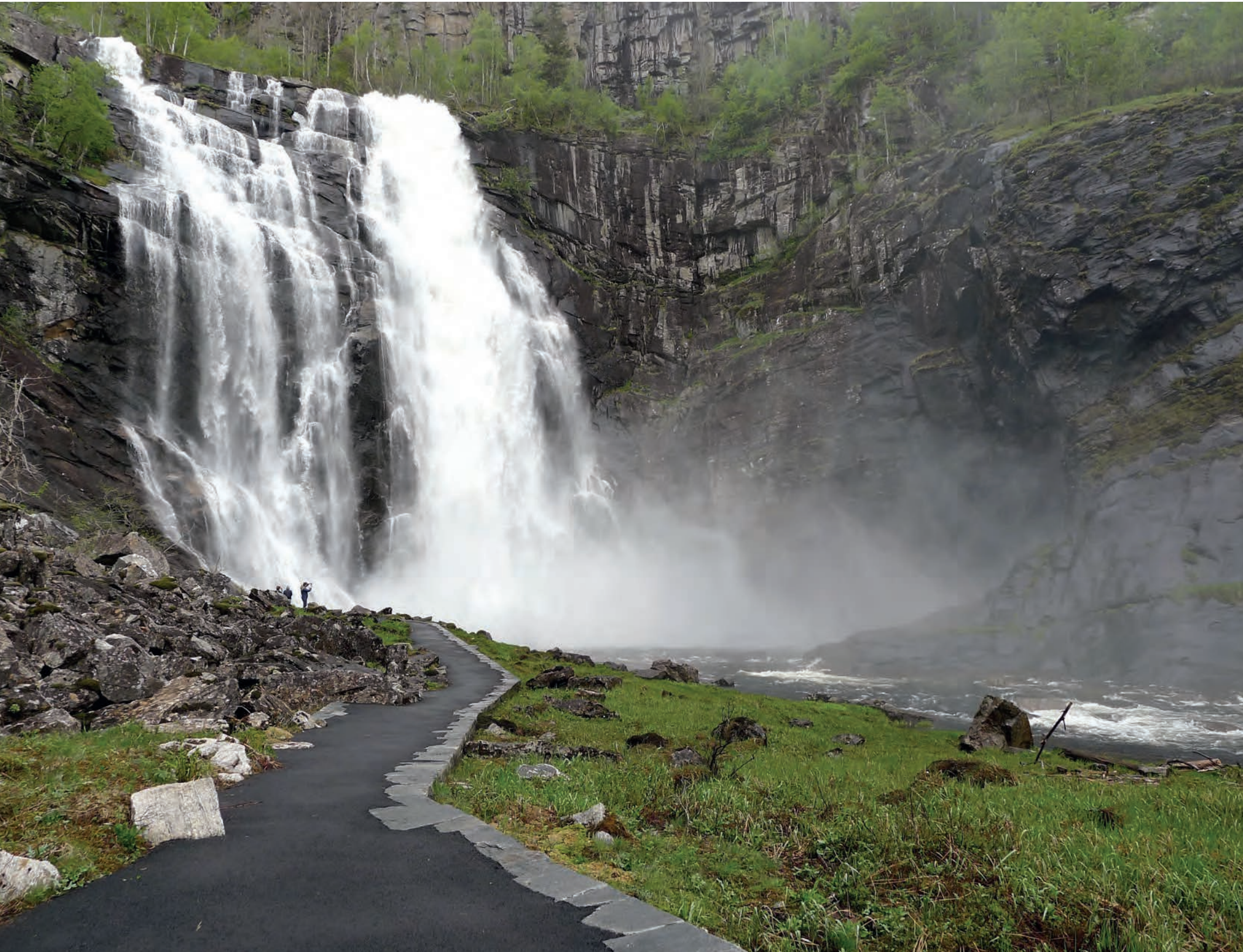
Camino hacia el pie de la cascada