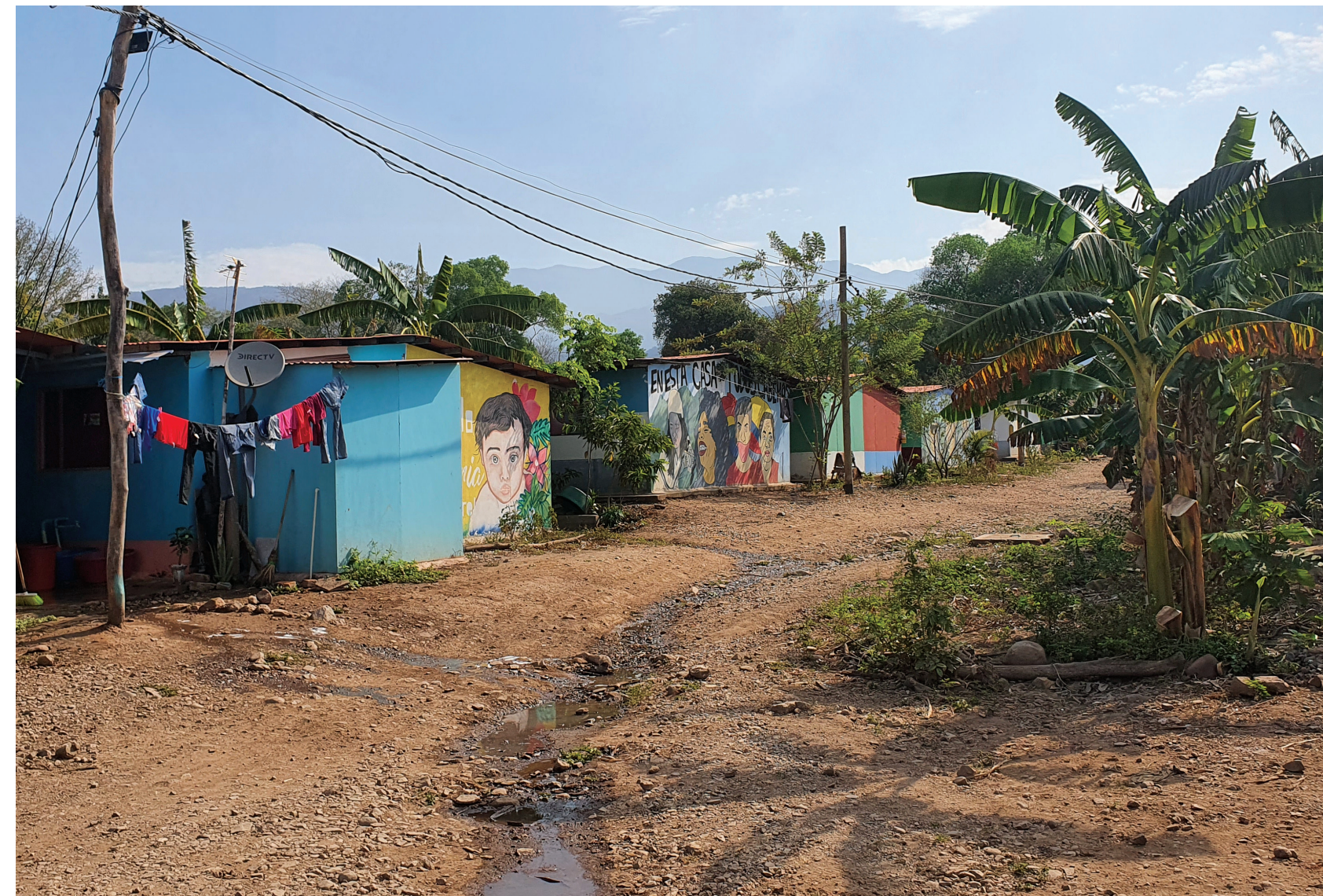
Figura 26_ Localización de los ETCR Tierra Grata en el Departamento del Cesar y Pondores en el Departamento de la Guajira, cerca a dónde se desarrollará el proyecto de vivienda "Ciudadelas de Paz". Figuras 27 y 28_ Unidades de vivienda temporales en el ETCR de Pondores.

Al vincular las oportunidades de sustento con la producción de vivienda, 350 excombatientes que actualmente viven en dos espacios territoriales de capacitación y reincorporación han establecido y recibido capacitación para conformar unidades productivas de producción de bloques de tierra compacta, carpintería y ornamentación. Esto no solo proporciona la capacidad técnica para que los excombatientes construyan sus casas a través de un enfoque de ayuda mutua, sino que los capacita como expertos en construcción. Ciudadelas de Paz es una apuesta por parte de la comunidad de excombatientes de que a través de su proceso de reincorporación puedan crear vínculos con comunidades vecinas y contribuir a la sociedad colombiana con alternativas para responder a la crisis de vivienda que agobia al país y a la región.